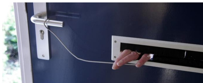
Draai uw ramen en deuren echt op slot; voorkom 'hengelen'.

Laat de sleutel niet in het slot zitten. Inbrekers kunnen anders onder het slot een gat boren en vervolgens met behulp van een geprepareerd voorwerp de sleutel omdraaien (gaatjesboormethode). Of ze slaan het glas in zodat ze met hun hand de sleutel kunnen omdraaien.